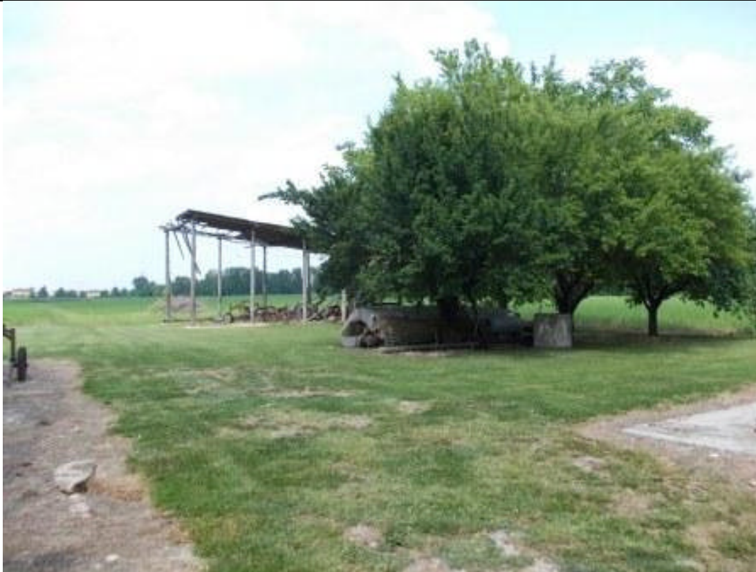
MIR CA 30 (1)