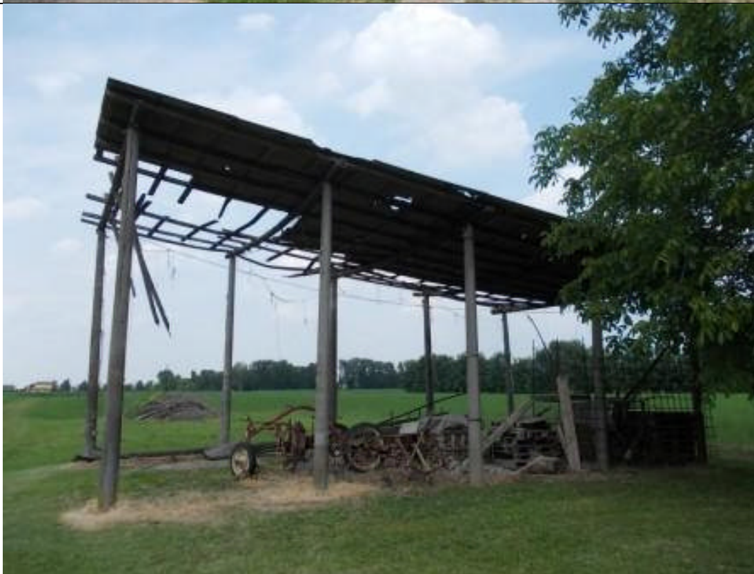
MIR CA 30 (2)